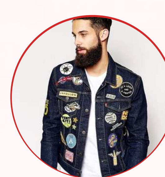
Chaquetas de jean con exceso de pines