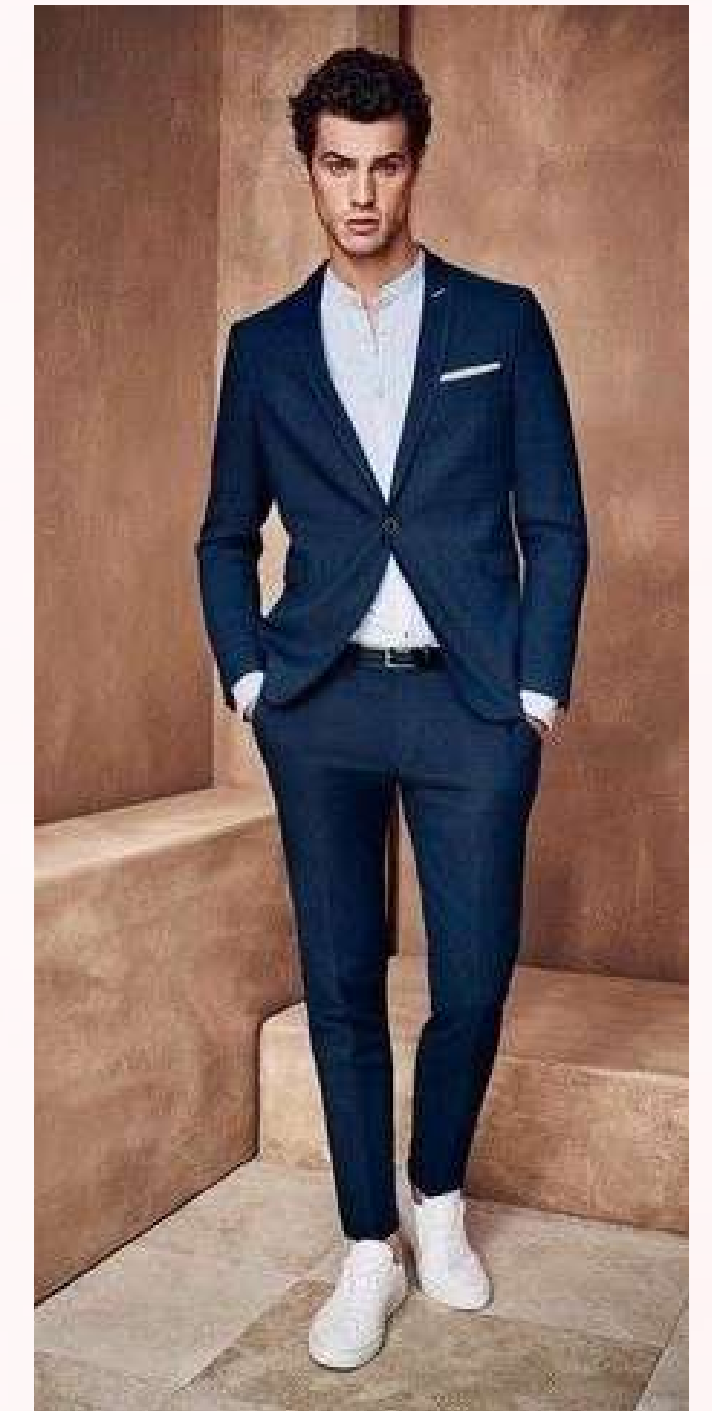
*Imágenes de referencia