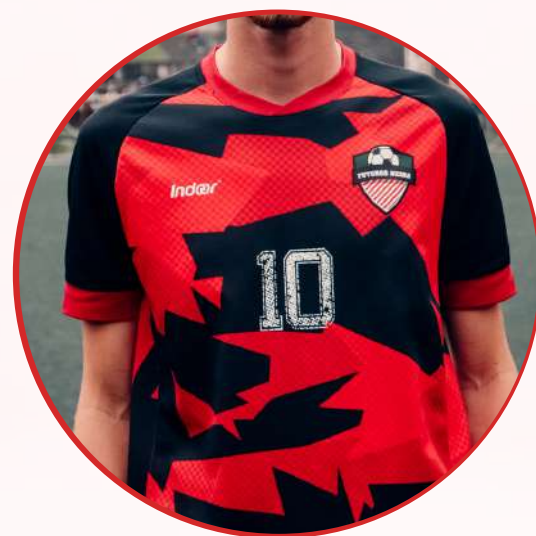
Camisetas alusivas a equipos