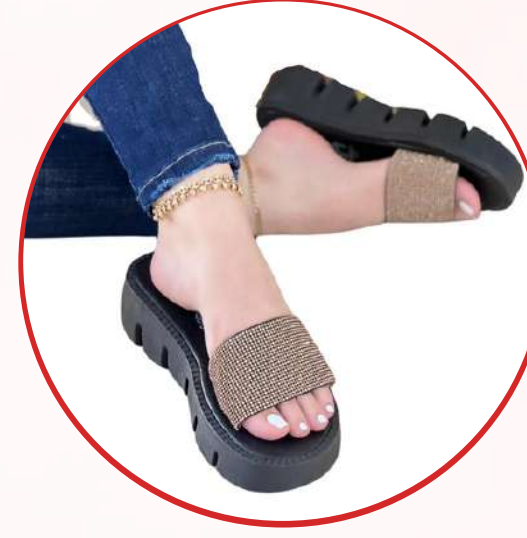
Sandalias / Chanclas