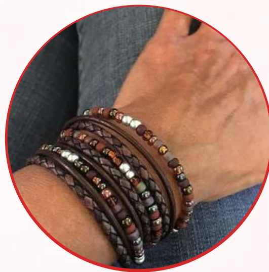
Exceso de accesorios