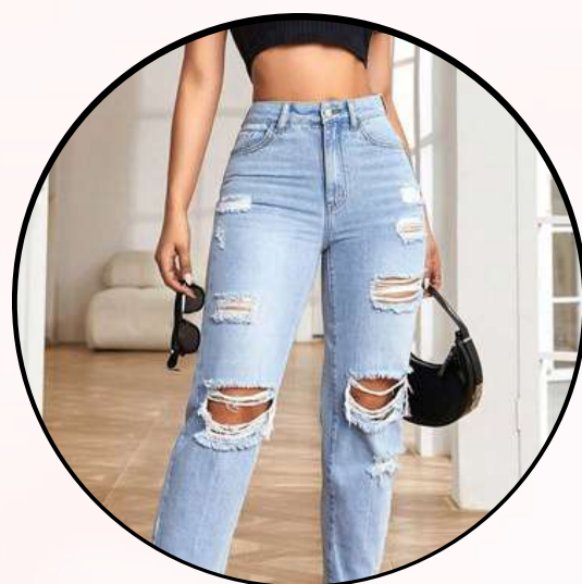
Jean o pantalones con rotos