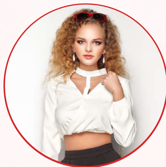
Blusas cortas / Escotes