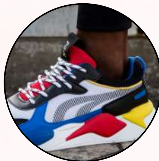
Tenis deportivos o de colores