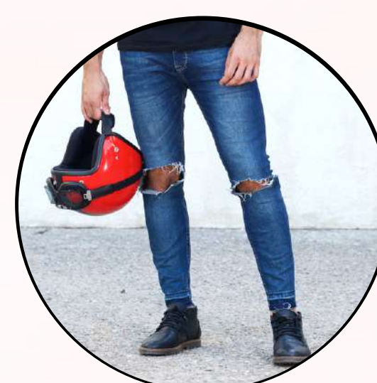
Jean o pantalones con rotos