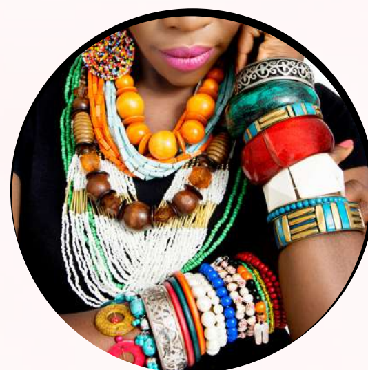
Exceso de accesorios