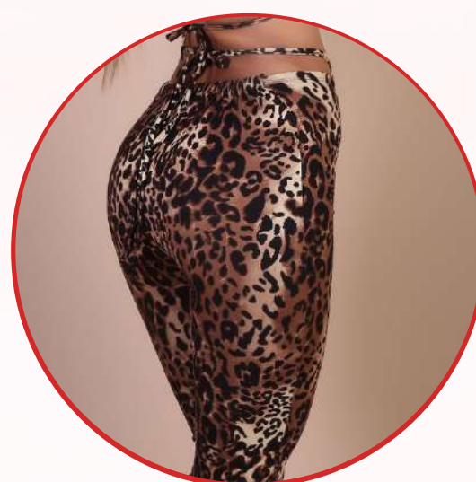
Estampados animal print