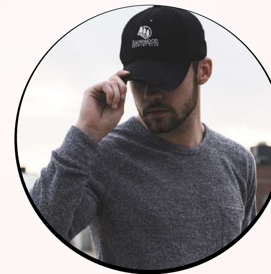
Gorras / cachuchas