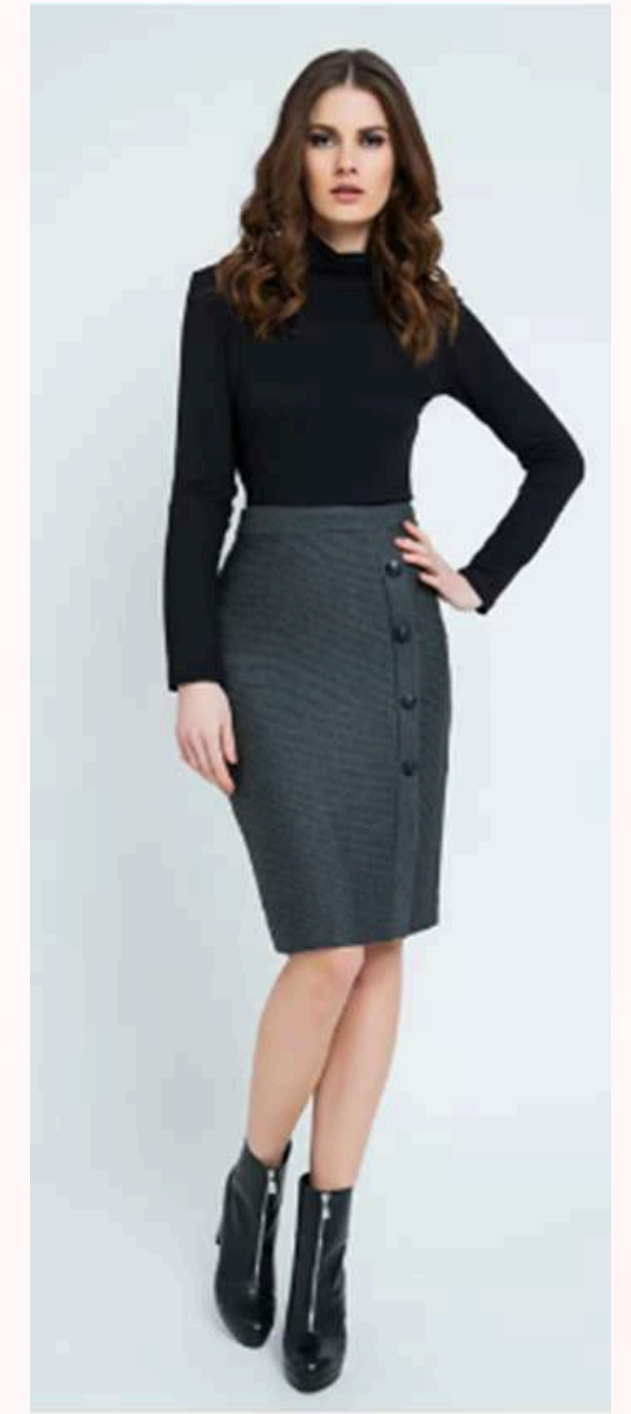
*Imágenes de referencia