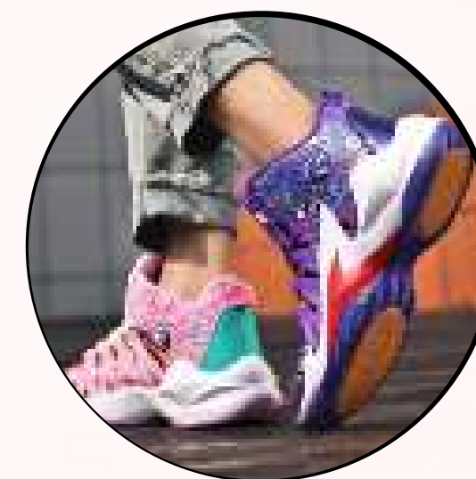
Tenis deportivos o de colores