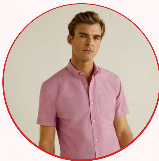
Camisas manga corta