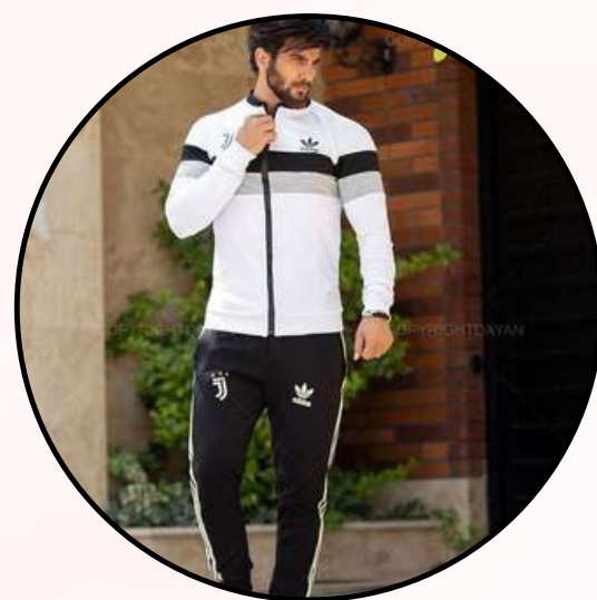
Ropa deportiva / Sudaderas